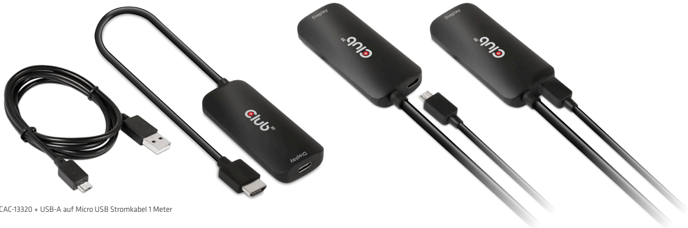
CAC-13320 + USB-A auf Micro USB Stromkabel 1 Meter

Hinweis: Dieser Adapter funktioniert nur mit USB-Type-C-Displays mit eigener Stromversorgung!